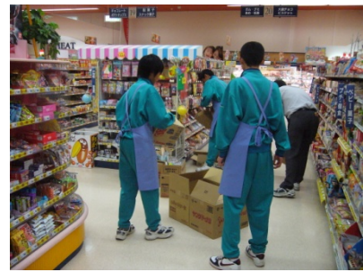
2年生職場体験学習