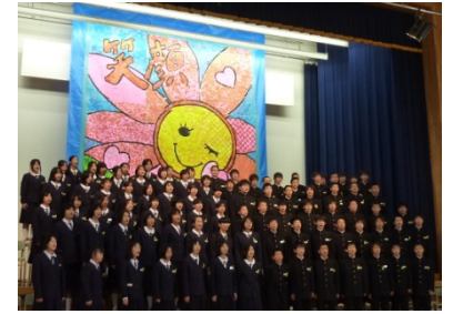
10月 愛宕祭（合唱コンクール）